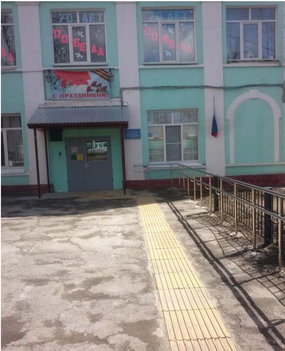
Доступный подход к зданию с поручнями и напольной тактильной плиткой