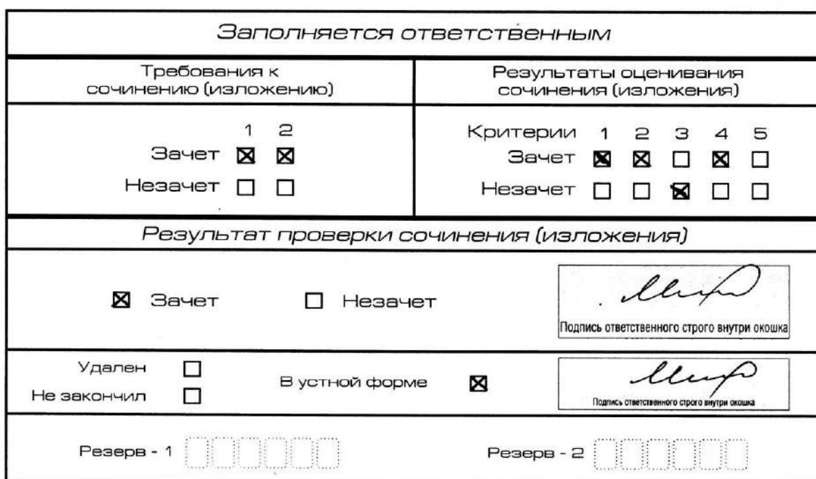
Рис. 11. Область для оценки работы сочинения (изложения) в устной форме

После окончания заполнения бланка регистрации ответственное лицо ставит свою подпись в специально отведенном для этого поле.